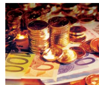
Nette Pleite – Eine Bilanz Seite 4