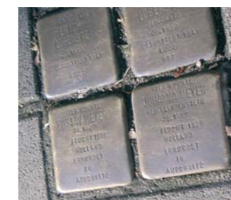
Aktion „Stolpersteine“ Seite 3