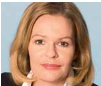
Nancy Faeser neue SPD Chefin – Seite 3