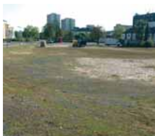
Nichts passiert! Seite 4