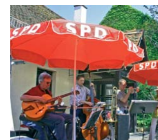
1. Mai Jazz Seite 1