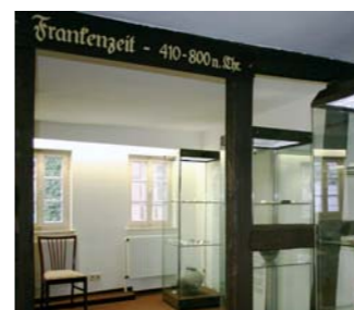
Heimatmuseum Seite 2