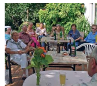
Lesen im Freien Seite 3