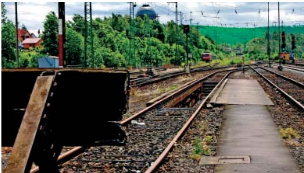
Wir schieben Hochheim nicht aufs finanzpolitische Abstellgleis