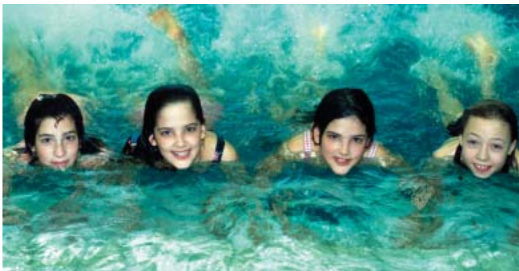
Diese fröhlichen Wassernixen haben sichtlich Spaß am Schwimmen. Die SPD unterstützt die Initiative „Pro Hallenbad“, damit sich auch in unserem Kreis endlich etwas in Sachen Schwimmbädern tut.

Kreis und die Gemeinden Eschborn, Bad Soden, Schwalbach und Sulzbach sind gefordert, in gemeinsamer Anstrengung und Mitteleinsatz eine zentrale Einrichtung zu schaffen, damit diesem unerträglichen Zustand abgeholfen werden kann. Gerade in Zeiten knapper Kassen müssen Prioritäten für die Gesundheit unserer Kinder und Jugendlichen gesetzt werden.